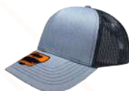
JASPE CLARO NEGRO/127