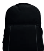
NEGRO JASPE /119