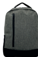
JASPE CLARO /127